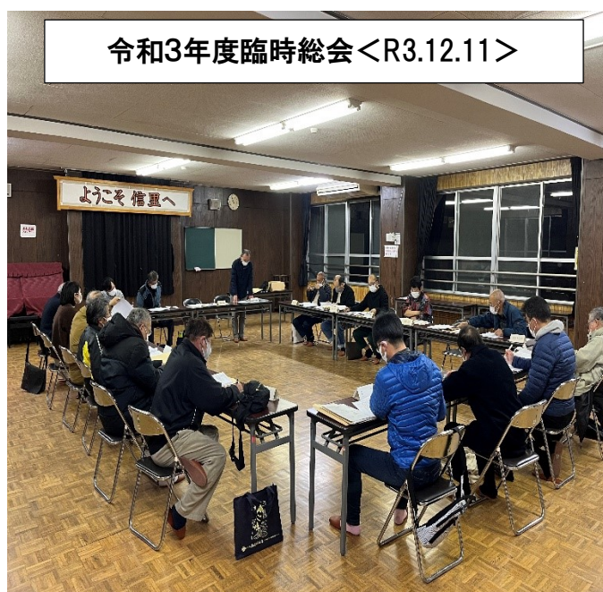
令和3年度臨時総会<R3.12.11>

役員の任期は、毎年6月から翌年6月までの1年間です。例年6月に総会を開催して新役員に引継ぎをしています。なぜ、そんな変則な時期かというと、「のぶさと号」を運行するにあたり、バス運行委員会とアルピコタクシー(株)との間で運行業務の委託契約を締結していますが、例年、業務委託期間満了日(3月31日)後に委託料の支払等の清算事務があるため、6月頃に引継ぎをするような慣習になっているようです。 今年度の活動目標は、「乗合タクシーのぶさと号の乗車人数の増加を図るため、PR活動を積極的に行うこと」です。