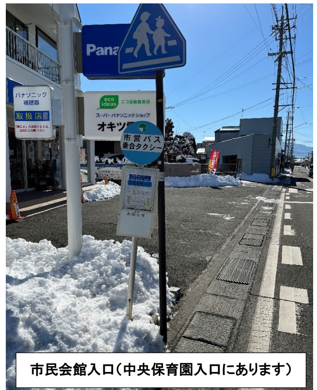
市民会館入口(中央保育園入口にあります)