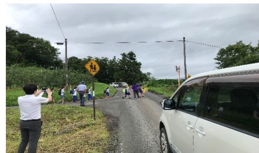
通学路の交通整理